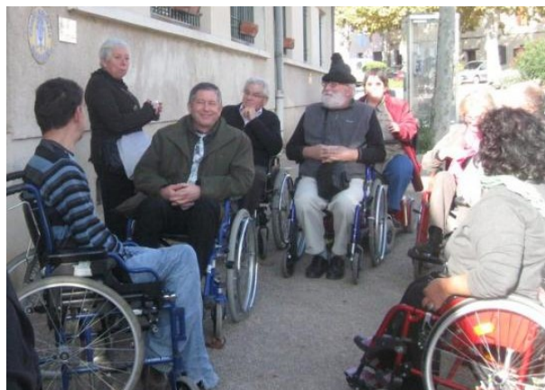
Cette expérience devrait inspirer les élus des communes du département et alentours.

née par le pot de l'amitié offert par la municipalité. Les intervenants ont continué d'échanger sur ce