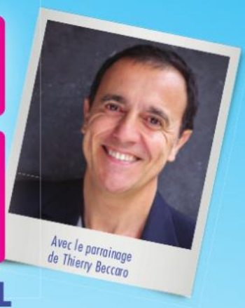
Avec le parrainage de Thierry Beccaro