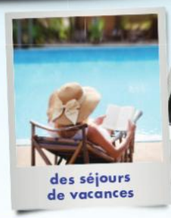
des séjours de vacances