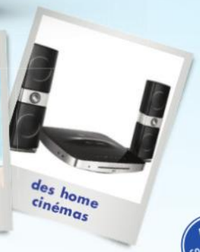
des home cinémas